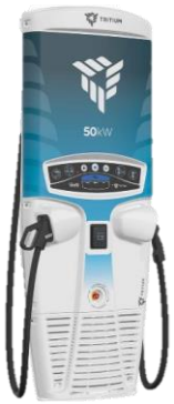
TRITIUM RT50 By Tritium