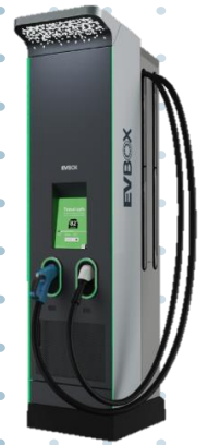
ULTRONIQ 175-350 by EVBox