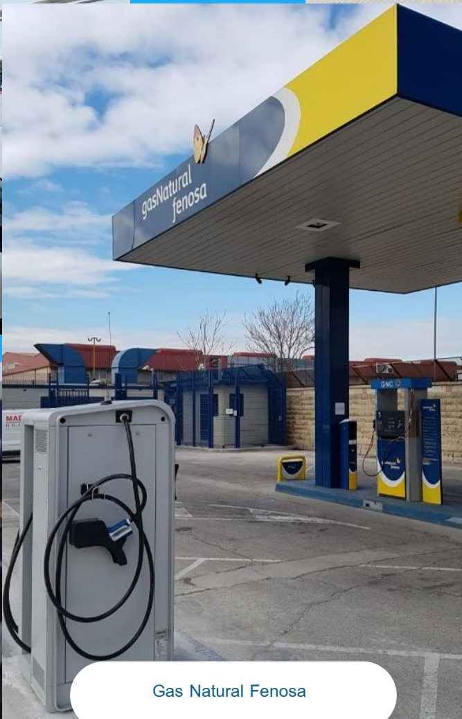
Gas Natural Fenosa