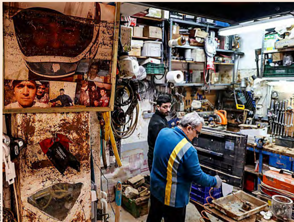
Ayer volvió a llover en las zonas afectadas y hubo restricciones a la circulación.

Los empresarios consideran que “algunas de las medidas adoptadas por el Ministerio de Trabajo en relación con