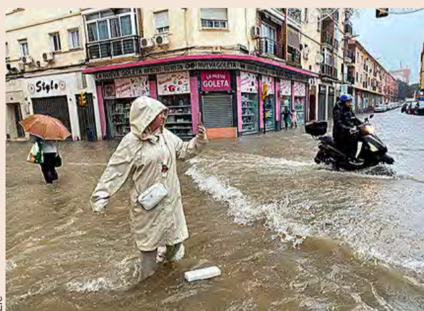
Las lluvias torrenciales inundaron y colapsaron el centro de Málaga.

En Málaga capital, se contabilizaron casi 68 litros por metro cuadrado en tan solo una hora. El temporal obligó a cancelar todas las líneas del servicio municipal de autobús y colapsó el centro de la ciudad. Se inundaron el Hospital Clínico Universitario y varias calles de la ciudad, como la avenida de Andalucía,