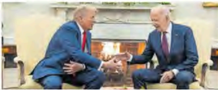
Trump y Biden, ayer en el Despacho Oval.