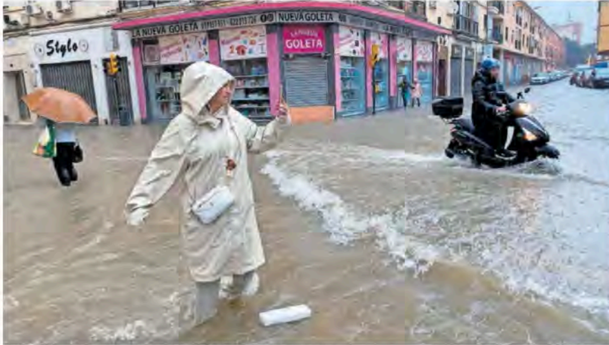
Varias personas, ayer en una de las calles inundadas de Málaga.

Los genetistas dan con la tecla para ganar sabor en los tomates —P41