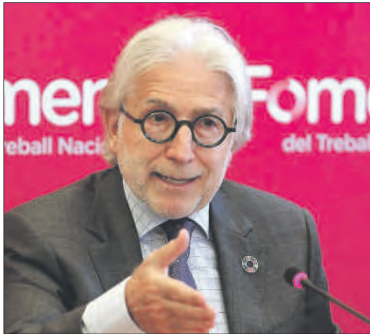
El presidente de Foment del Treball, Josep Sánchez Llibre. EE

En lo que se refiere a las mutuas, la patronal catalana advirtió de que la supresión de la exención fiscal de los seguros puede provocar un colapso del sistema público de salud, ya que muchos usuarios serán derivados hacia la cobertura universal. Además, alertó sobre el posible frenazo inversor en el inmobiliario, tanto dentro como fuera de España,