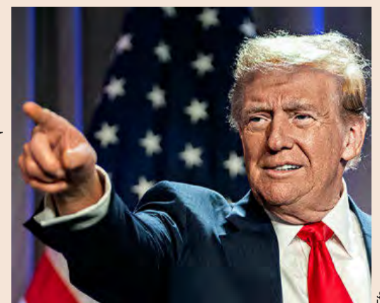
Donald Trump, futuro presidente de EEUU.

■ Los nombramientos de Trump apuntan a establecer una línea dura con China