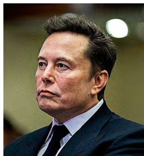
Musk, dueño de Tesla y aliado de Trump.

Musk: el más rico del mundo lo tiene todo, incluido el control de la burocracia en EEUU