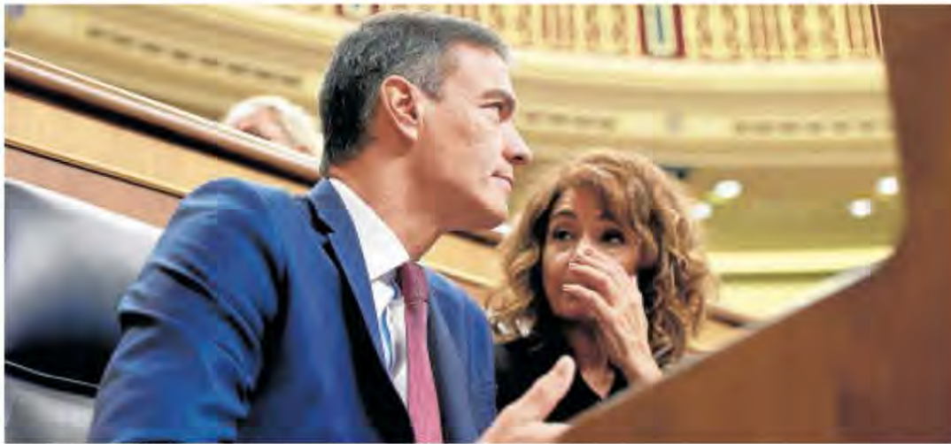
Pedro Sánchez y María Jesús Montero