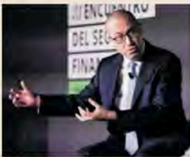
El CEO de BBVA, Onur Genç.

Inmobiliario. Evalúan el eventual impacto del fin de las ventajas tributarias y exploran un cambio de sede Negocio. El alquiler para vivienda en España supone el 1,4% de la cartera de Colonial y Merlin no tiene —P3-4