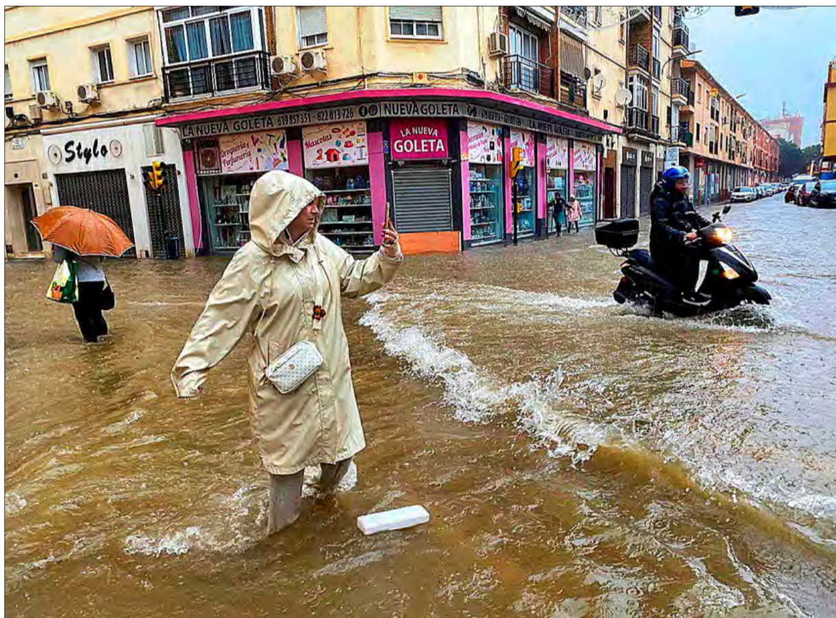
MARÍA ALONSO / EFE