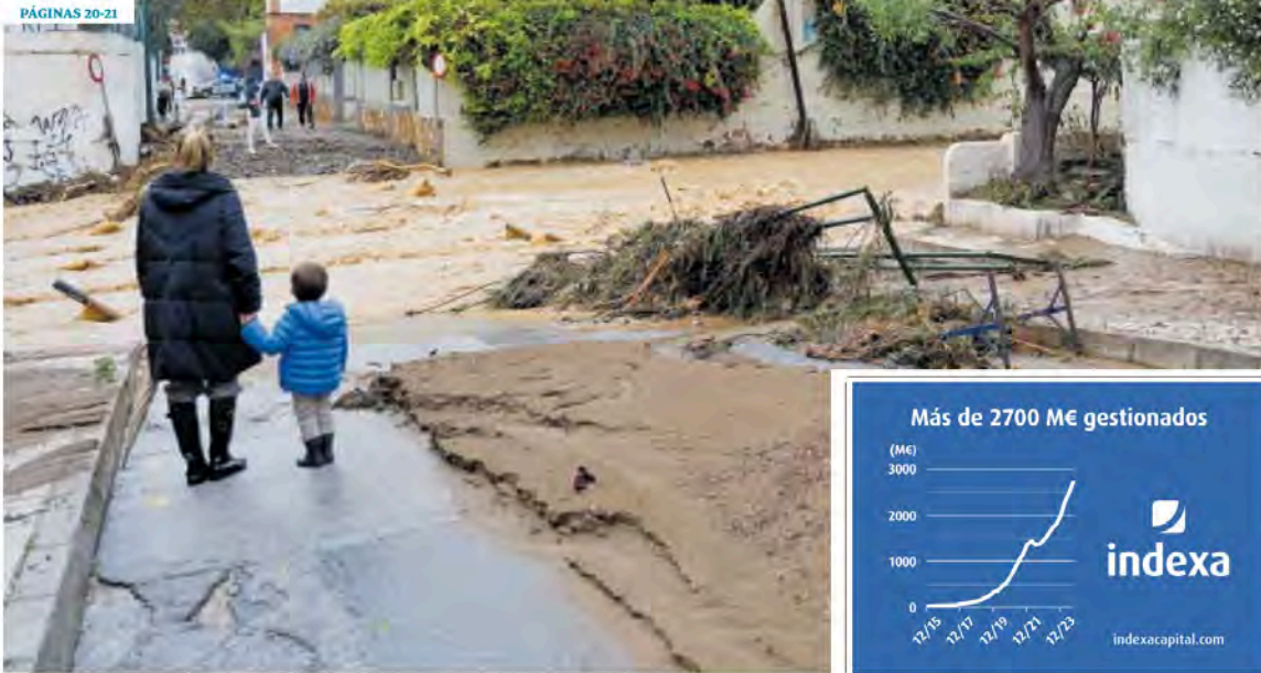
EDTO: MARLUZ BAEZ / SUR