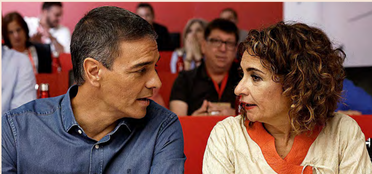
El presidente del Gobierno, Pedro Sánchez, junto con la vicepresidenta primera y ministra de Hacienda, María Jesús Montero

Aunque a Pedro Sánchez le gusta recordar que su etapa al frente del Gobierno está marcada por los desastres naturales o humanos a los que el Ejecutivo ha tenido que hacer frente (el coronavirus, la guerra en Ucrania, la espiral inflacionaria, la DANA, el volcán de la Palma...), desde el punto de vista de los ciudadanos y las empresas sus distintos mandatos probablemente han quedado más bien teñidos por las constantes subidas de impuestos que han lastrado el poder adquisitivo de las familias y los márgenes corporativos. De hecho, un estudio del Instituto Juan de Mariana señala que desde que Pedro Sánchez llegó al gobierno, en 2018, el Ejecutivo ha aprobado 81 subidas de impuestos y cotizaciones con un impacto de 14.625 millones de euros que, sumadas a los incrementos recaudatorios derivados de la no deflactación del IRPF, esto es, la no actualización con la inflación, han generado un impacto acumulado para los ciudadanos y las empresas de 41.725 millones.