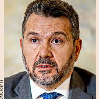
Rodrigo Buenaventura, presidente de la CNMV.