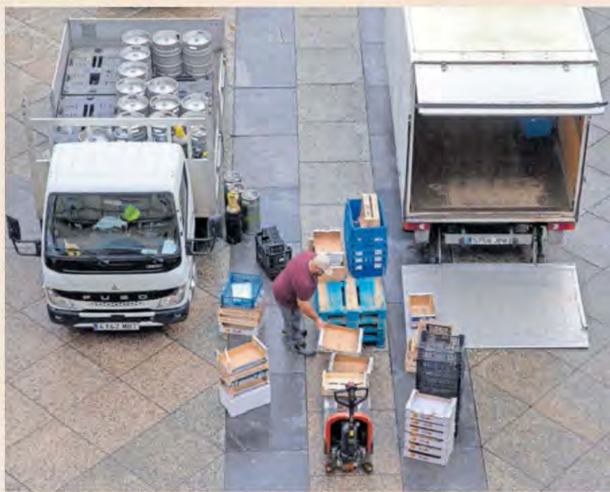
Descarga de furgonetas en la futura zona de bajas emisiones de San Sebastián.

Inicialmente estaba previsto que el nuevo estándar de emisio-