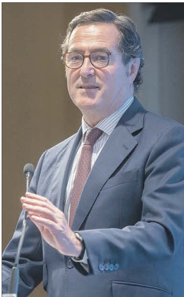
El presidente de CEOE, Antonio Garamendi.

Además, el Gobierno busca alternativas legales para evitar que en los próximos días se firmen contratos de trabajo que se desvinculen del SMI que estaba en vigor hasta esta mañana, cuando la extensión de los 1.134 euros mensuales deca-