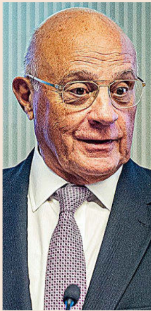
El presidente de Banco Sabadell, Josep Oliu.

En cuanto a los independentistas, la negativa de Junts