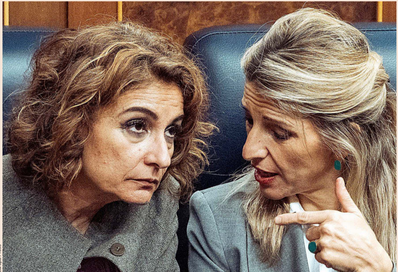
Las vicepresidentas primera, María Jesús Montero, y segunda, Yolanda Díaz, del Gobierno, ayer en el Congreso de los Diputados.

“Los que hayan seguido nuestras intervenciones (...) no se sorprenderán por lo que hacemos hoy. Hace semanas que el presidente Puigdemont advirtió de que mientras ustedes no cumplan, no cuenten con Junts”, manifestó la portavoz del grupo en el Congreso, Miriam Nogueras, alegando que la votación de ayer es “fruto de la negligencia y falta de seriedad del PSOE”. El Gobierno, dijo, “debe de dejar de jugar al triletero, y el resto [de partidos]