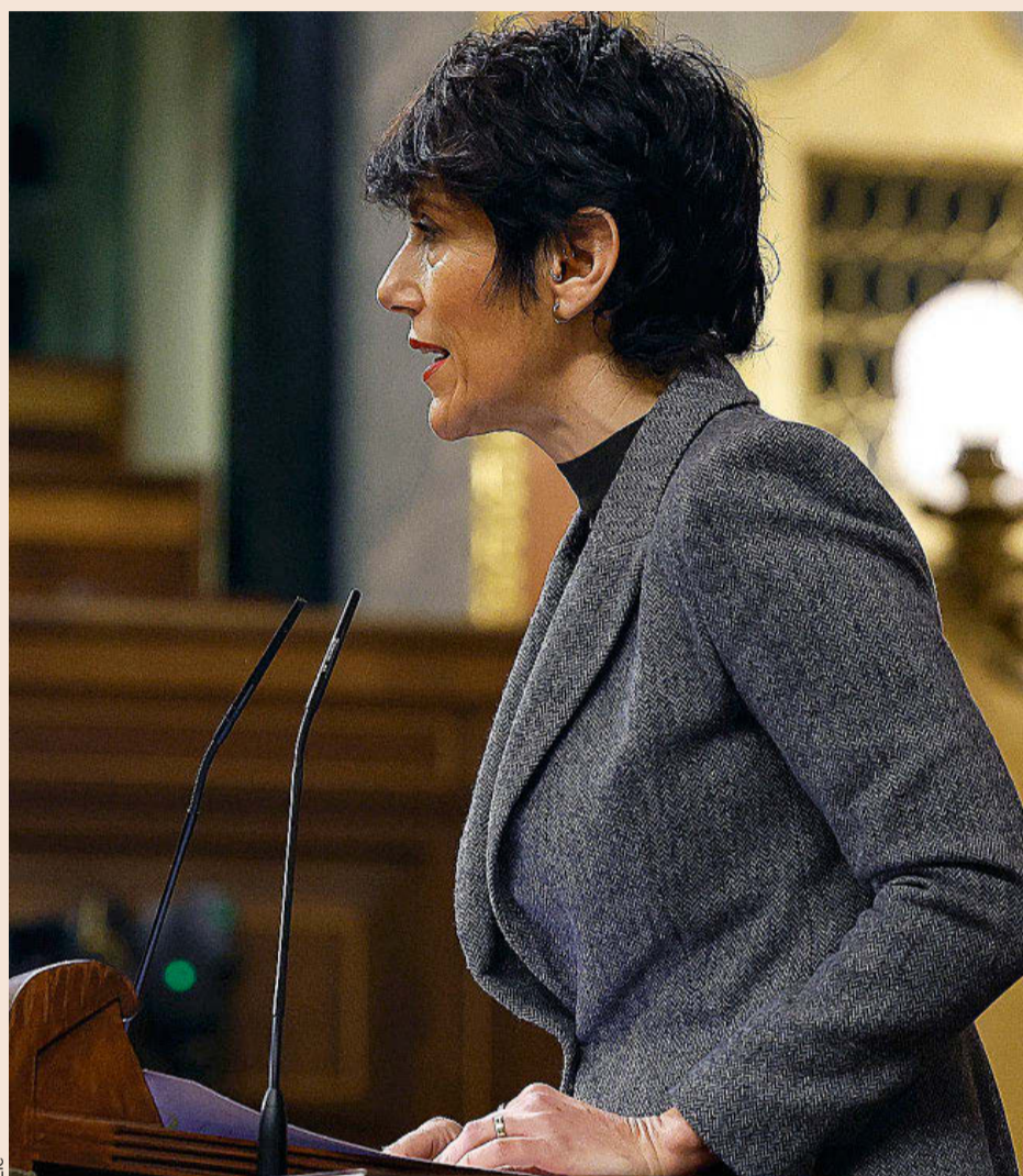
La ministra de Inclusión, Seguridad Social y Migraciones, Elma Saiz, ayer.

La jubilación parcial está pensada para llevar a cabo una salida gradual del mercado laboral, antes de alcanzar la edad de jubilación hasta alcanzarla y pasar de forma definitiva al retiro. Existen dos