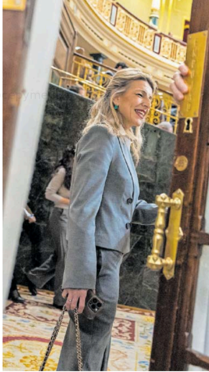
Yolanda Díaz, ayer en el Congreso de los Diputados.

Trabajo defiende la banda alta, un salto de 50 euros hasta los 1.184, en el que podría encontrarse con los sindicatos, que piden llegar hasta el entorno de los 1.200. A la pregunta sobre qué espacio hay para que el Gobierno acceda a las condiciones de la patronal, Pérez Rey no concedió margen. Le dio la vuelta al planteamiento, con la esperanza de que sean los empresarios los que renuncien a esas peticiones: "[Sobre] las bonificaciones en el ámbito agrario, no puedo evitar decir que hay un problema porque los sindicatos