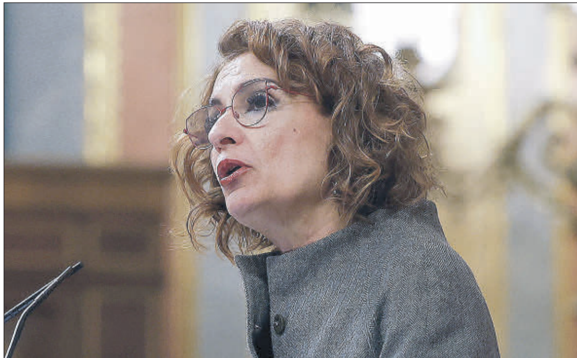
La vicepresidenta primera y ministra de Hacienda, María Jesús Montero.

Las palabras de la portavoz morada reavivaron la tensión que su formación mantiene con el PNV. “Sabían perfectamente que este gravamen no iba a salir adelante, necesitaba un relato para justificar su apoyo a una ley que no recogía sus reivindicaciones”, dijo la portavoz nacionalista vasca, Idoia Sagastizabal, que se dirigió a Belarra. “Para poder, necesita sumar. Yo entiendo que la palabra sumar no es de su agrado”, dijo con relación a la contienda que Podemos mantiene con los de Yolanda Díaz. Cabe recordar, que Podemos votó a favor de la reforma fiscal el pasado noviembre, tras alcanzar un acuerdo de última hora con el Gobierno, para impulsar la tasa a las energéticas. Un gra-