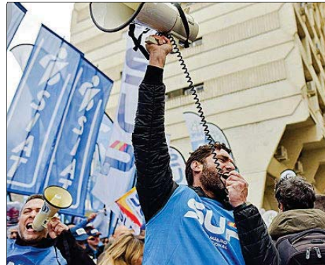
Protesta de funcionarios en defensa de Muface.

En lo que afecta al SMI, los sindicatos trasladaron su preocupación, si