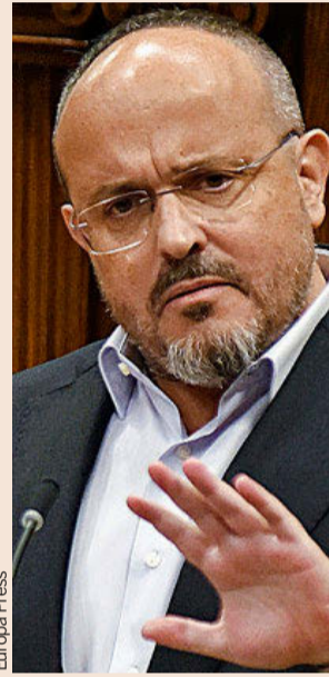
El líder del PP catalán, Alejandro Fernández.

ocurrido históricamente hasta el punto más álgido del procés . A la hora de calcular el PIB, la ubicación de las sedes sociales no es un factor determinante, pero sí que tiene un efecto reputacional. Hasta ahora los regresos han sido a cuentagotas, y ahora, nuevas empresas podrían sumarse a la decisión de Banco Sabadell. El líder del PP catalán, Alejandro Fernández, celebró el regreso, aunque recordó que