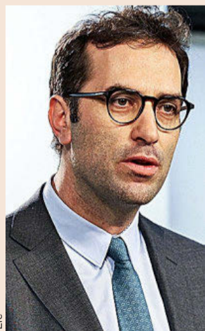
Carlos Cuerpo, ministro de Economía, Comercio y Empresa.

Salvador Illa, presidente de la Generalitat de Cataluña, que también mostró su optimismo y dice que el cambio de sede social significa que “vamos por el buen camino, basado en el buen gobierno,