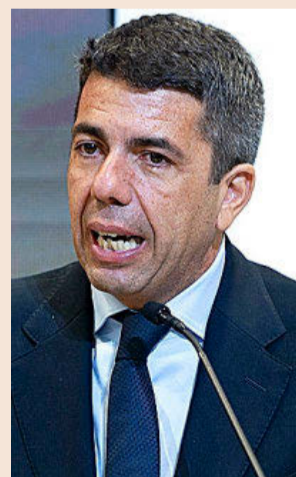
Carlos Mazón, presidente de la Generalitat valenciana.